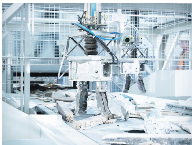
【ゼンロボティクス製品写真】