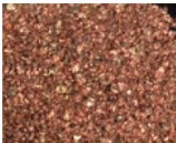
ラジエーターから回収した銅