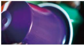
コーヒーカプセル