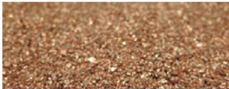
ケーブルから回収した銅