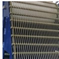
強靭なワイヤーメッシュ