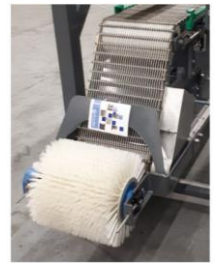
クリーニング用ブラシメッシュをきれいにします。