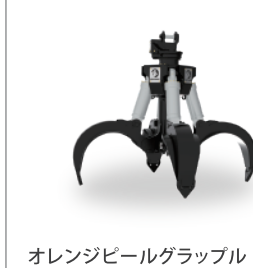
オレンジピールグラップル