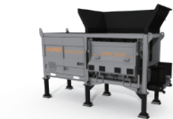
CERON TYPE 256