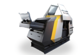
ユニソートブラックアイ